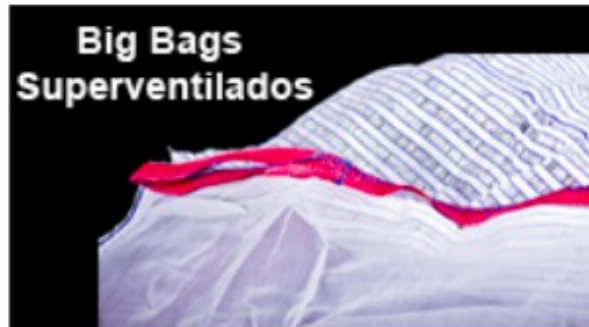
Big Bags Superventilados