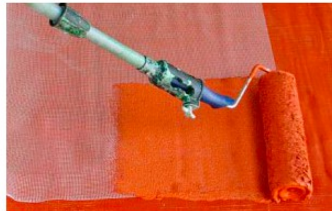
MALLA DE PINTURA