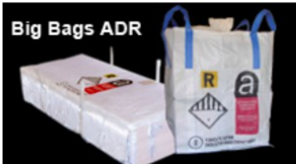
Big Bags ADR