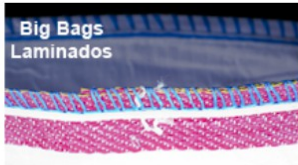
Big Bags Laminados